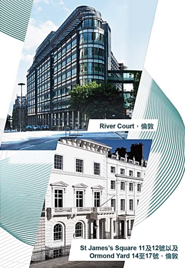
River Court · 倫敦

以上所載資料並不構成法定之業績公布。 本公司之業績公布已登載於公司網站 http://www.chineseestates.com 及「披露易」網站 http://www.hkexnews.hk